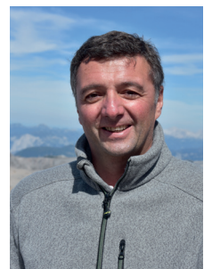
Mag. Jörg Leichtfried