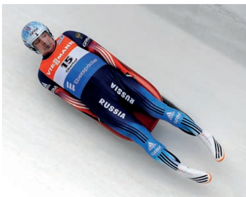
Albert Demchenko / RUS