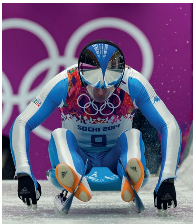
Armin Zöggeler / ITA