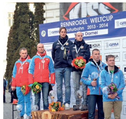
Siegerehrung Weltcup-Gesamtwertung 2013/2014 Doppel Winners ceremony 2013/2014 overall world cup doubles