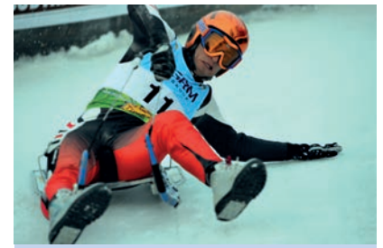
Die Parallel-Rennstrecke auf der Seiser Alm / ITA The parallel race track at Seiser Alm / ITA

Team Türkei an vierter Stelle. In der vergangenen Saison fand erstmals bei allen Weltcuprennen – außer beim Parallelbewerb - auch ein Teambewerb statt. Dass sich die Mannschaften aus Italien, Russland und Österreich – in dieser Reihenfolge – die Medaillen in der Gesamtwertung sichern würden, war vorauszusehen. Dass allerdings die Mannschaft aus der Türkei an vierter Position landen würde hätte wohl niemand vorausgesagt. Konsequente Teilnahme an allen Rennen und akribisches Training machte aus den Newcomern innerhalb weniger Jahre ernsthafte Konkurrenten.