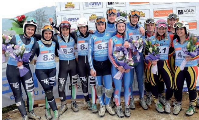
Blumenzeremonie Mannschaftsbewerb 9. FIL-Juniorenweltmeisterschaften Naturbahn Flower ceremony team competition 9 th FIL Junior World Championships Natural Track