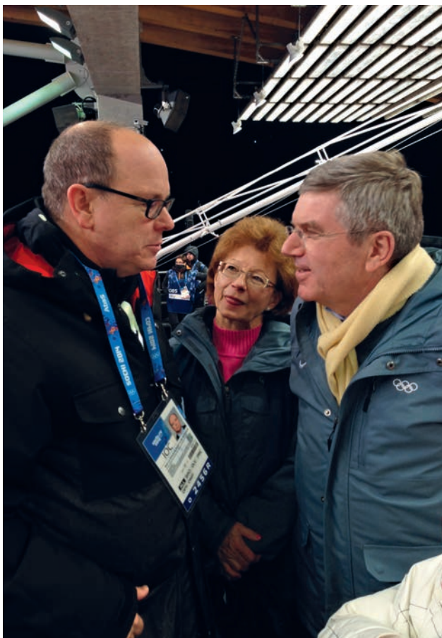
Fürst Albert II von Monaco mit IOC-Präsident Dr. Thomas Bach Prince Albert II of Monaco with IOC President Dr. Thomas Bach