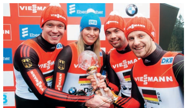
Gesamtsieger ViessmannTeam-Staffel-Weltcup presented by BMW 2014: Deutschland Overall winner 2014 Viessmann Team Relay World Cup presented by BMW: Germany