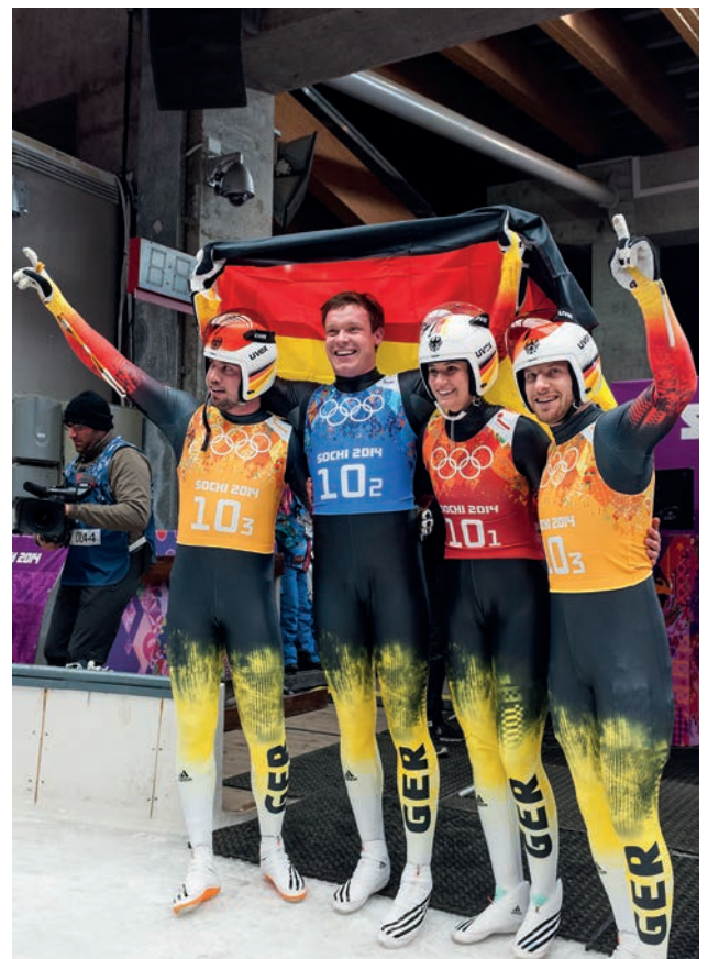
Olympiasieger 2014 in der Team-Staffel: Deutschland 2014 Team Relay Olympic Champion: Germany