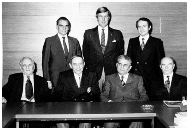
Erhardt Feuereiß als Mitglied des FIL-Präsidiiums 1980 Erhardt Feuereiß as member of the FIL Presidium in 1980