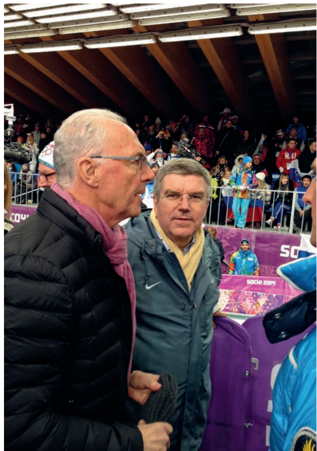
Deutschlands Fußball-Legende Franz Beckenbauer mit IOC-Präsident Dr. Thomas Bach German soccer legend Franz Beckenbauer with IOC President Dr. Thomas Bach