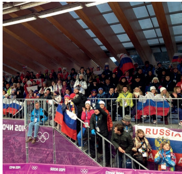
Begeisterte Stimmung im Zielbereich bei den Rennrodelbewerben Enthusiastic atmosphere in the finish area at the luge competitions