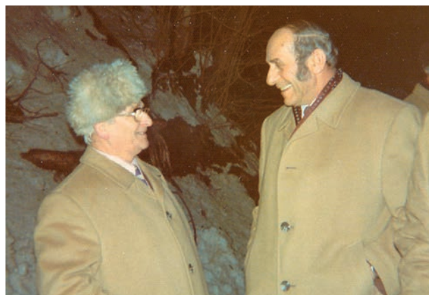
Erhardt Feuereiß im Gespräch mit FIL-Präsident Bert Isatitsch 1976 Erhardt Feuereiß talking with FIL President Bert Isatitsch in 1976