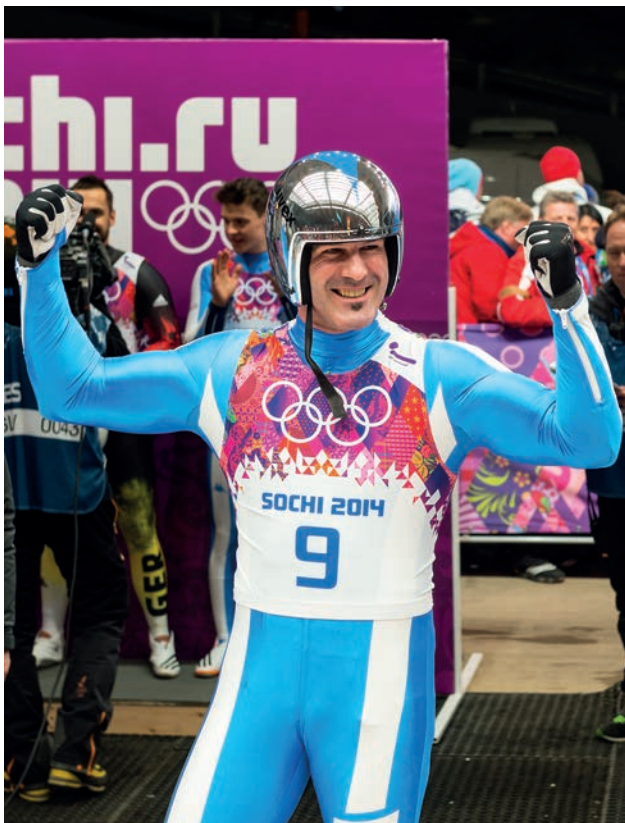
Armin Zöggeler (ITA) freut sich über seine 6. Olympiamedaille Armin Zöggeler (ITA) is excited about his 6 th Olympic medal