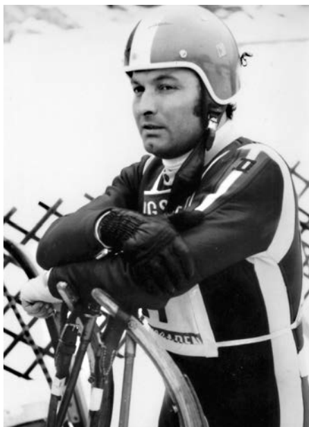
Josef Feistmantl 1969 bei der WM in Königssee/GER Josef Feistmantl 1969 at the WCh in Königssee/GER