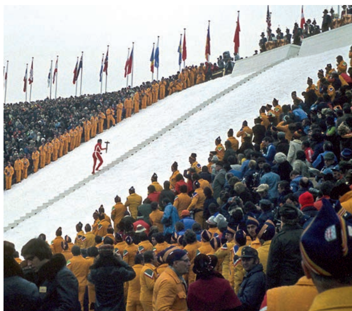
Josef Feistmantl auf dem Weg, das Olympische Feuer in Innsbruck 1976 zu entfachen Josef Feistmantl on his way to ignite the Olympic flame in Innsbruck 1976