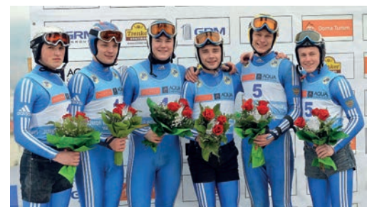
Das starke russische Naturbahn-Nachwuchsteam The very strong Russian natural track juniors team