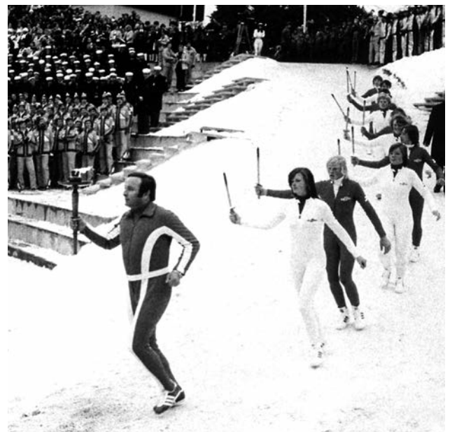
Josef Feistmantl mit der Olympischen Flamme beim Einmarsch ins Bergiselstadion 1976 Josef Feistmantl with the Olympic flame marches into the Bergisel stadium 1976