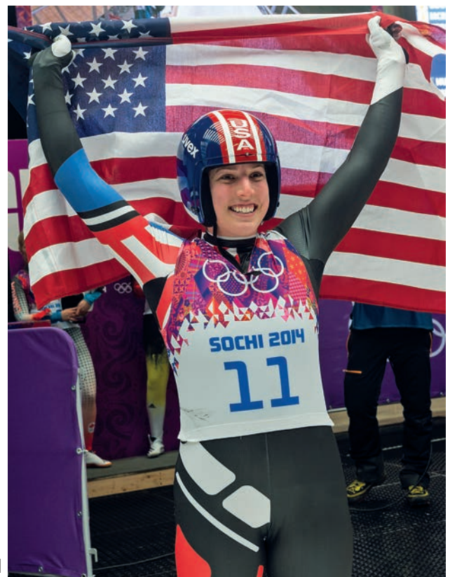
Erin Hamlin (USA) kann ihre Freude über die Bronzemedaille kaum fassen Erin Hamlin (USA) can't believe her happiness about her bronze medal

Actually she would have preferred fulfilling this dream four years earlier. “I had my best season up until then in 2010 leading up to Vancouver,” Erin Hamlin remembers. After finishing fourth in the World Cup overall standings, she had been viewed as a candidate to win a medal there but ended up way back in 16 th place. One Olympiad later her sixth-place finish in the overall standings allowed her to be included in the widening circle of candidates for medals. In the end she held the medal in her hands. Laughing she said, “In any case this way turned out to be the best.”