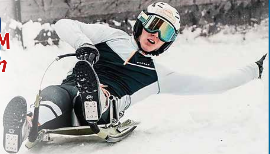
Sebastian Feldhammer/SV St. Sebastian ©m.jennewein